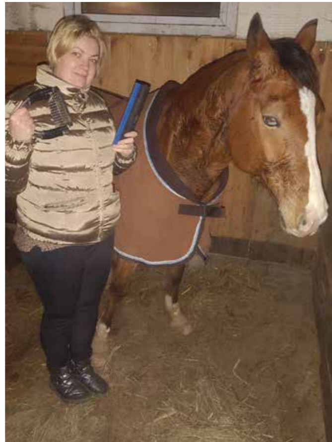
En glad hesteejer med udstyr, der gør en forskel