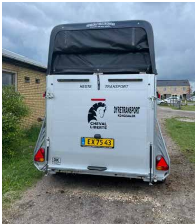
Kør med nettet nede

Jeg kører altid med "lukket" net bagtil, så hesten ikke skal have fokus på lastbiler eller andre ting der er for tæt på. Jeg oplever ikke, det bliver varmt i traileren, da jeg netop har et net og ikke en plade eller plastik.