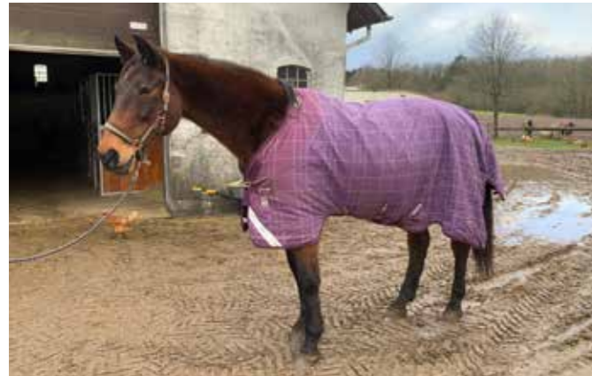
Lazaras med nyt dækken.

Vi fik en dejlig varm donation fra bot-shop.dk. Det var kasser med varme dækkener til vores heste. Vi er storforbruger af dækkener, da hestene ofte leger og bider i dækkenerne. Horseware sidder rigtigt godt på hestene og er også mere holdbare, så vi ikke så ofte skal skifte og reparere dem. Vi siger STOR TAK.