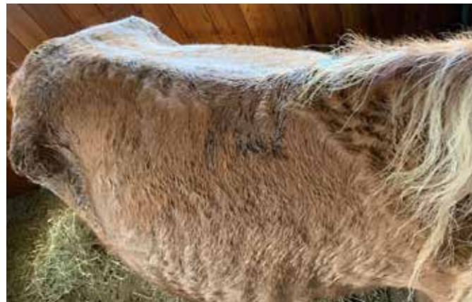
Glámur ved ankomst