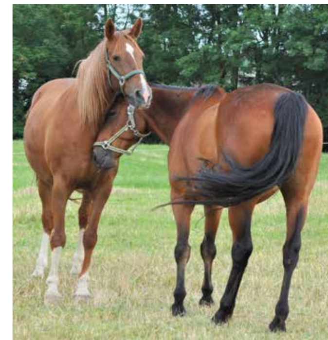
Lady Carrie og Diego

det nye venner, efter de er kommet til Nyt Hesteliv. Er hestene meget knyttede til hinanden og stadig holder sammen, så skal de forblive sammen.