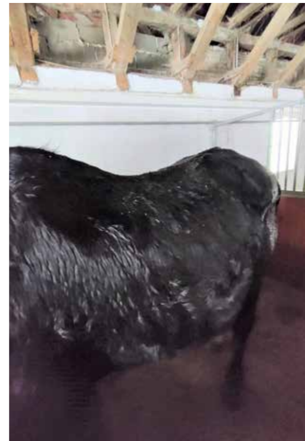
Lillebror ved ankomst