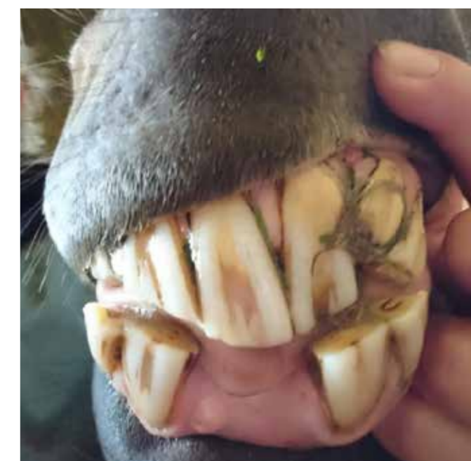
Det har virkelig gjort ondt på hesten!

Dette gælder både store heste og små ponyer, men især de gamle heste, selv om de ikke rides mere. Selv uden bid i munden, kan hesten have store smerter med deres tænder.