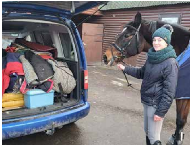
Der blev sendt mange gode og varme ting afsted

Vi har doneret noget af det udstyr, som vi havde i overskud, til hestene i Ukraine. Mange af hestene i Ukraine er i stor nød. Det er Fair Dogs der har kørt rundt og samlet udstyr ind og kørt det til Ukraine. I denne kolde tid i Ukraine var det især de varme staldækkener som vakte stor begejstring, men også bandager kunne bruges til mange andre ting end hestene. De tog imod ALT med kyshånd. De ældre sadelunderlag blev internaterne for hunde og katte også meget glade for, da dyrene nu kunne ligge mere blødt og lunt.