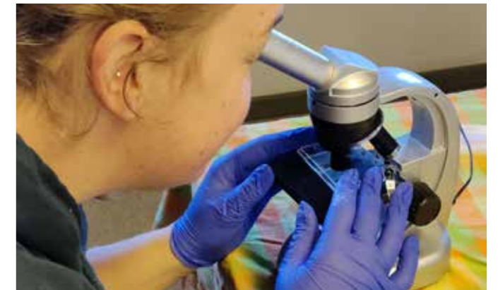
Til sidst skal der tælles