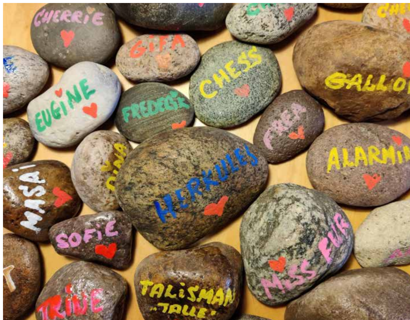
Vi elsker at kigge på de fine mindesten