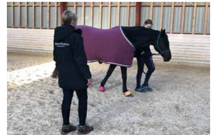
Undervisning i hensigtsmæssig placering.

Vi lavede senere bomøvelser, bl.a. labyrinter, og signalerne var blevet super fine og bløde og træningen foregik derefter uden frustrationer.