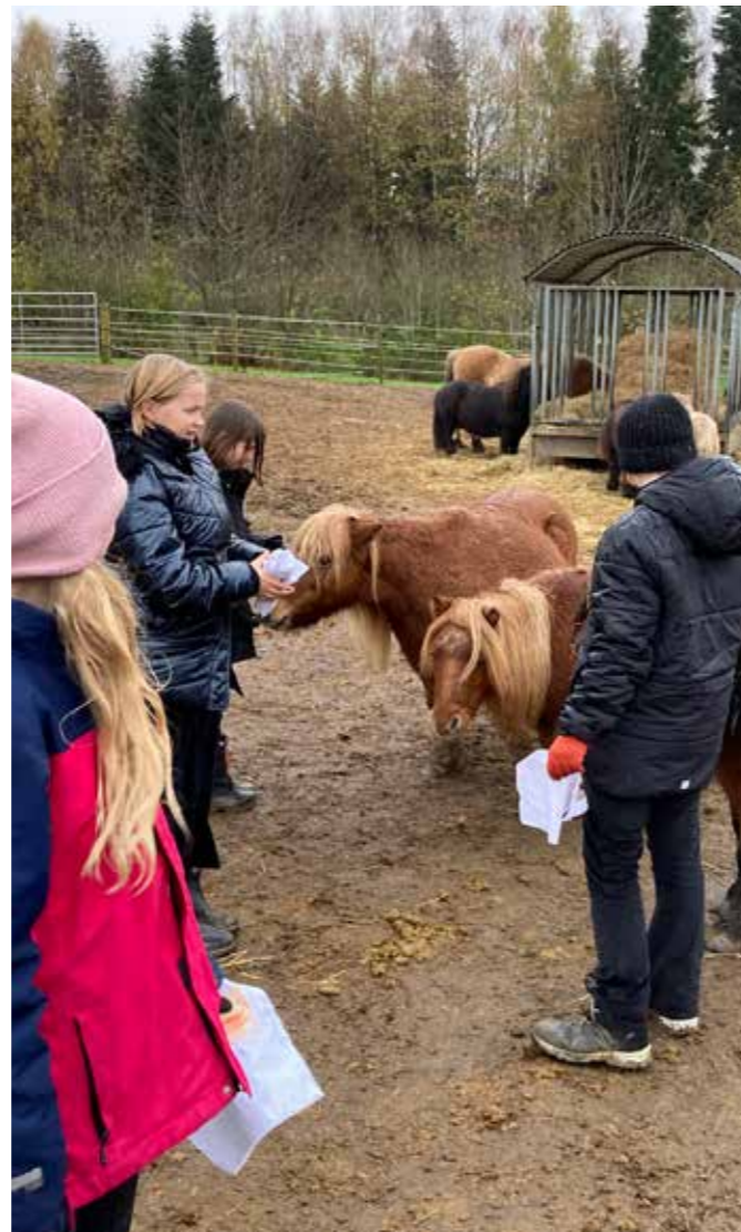
... som løses med ponyerne i ponyskoven