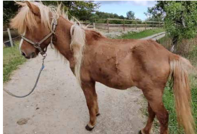
Glámur ved ankomst

Vi fik en livredder ud for at tale med ejeren, hvilket