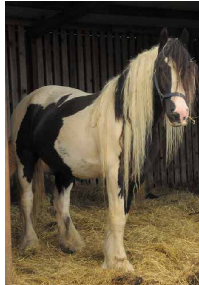
Kashmir ved ankomst

Kashmir var uglejet men ok i huld. Han kan være meget dominerende, så vi forestiller os, at det foder, de har fået tildelt, har Glamur ikke fået del af. Desværre lugtede hans hove rigtig fælt og var i en rigtig dårlig forfatning pga gammel sur hov. Da det blev skrællet af og beskåret, fik Kashmir de fineste hove.