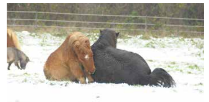
Pegasus (rød) og Sonny (sort) havde en fest i den skønne nyfaldne sne