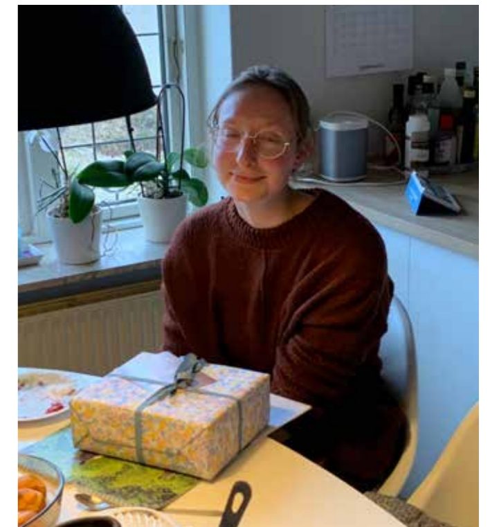
Hanna hos Nyt Hesteliv