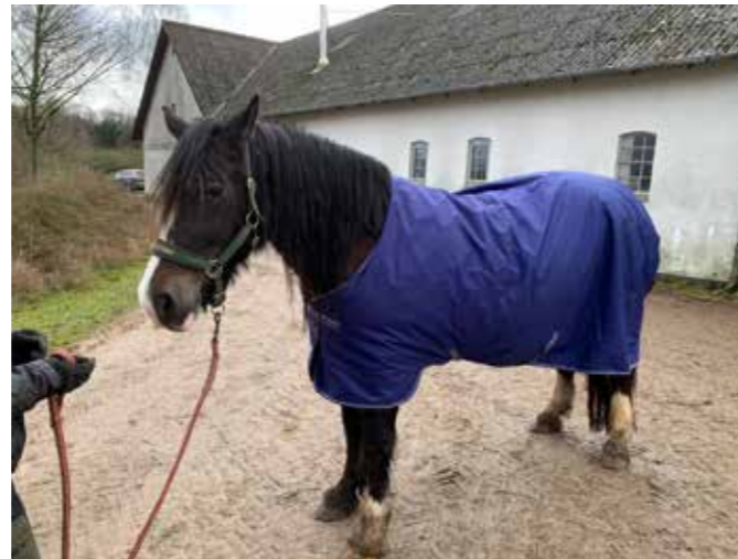
Isa med nyt dækken.