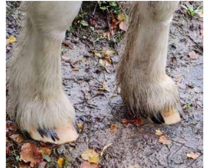
Kashmir med fine hove