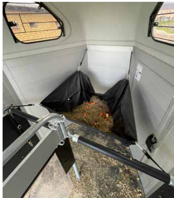
Brug et sejl i stedet for hønet

Jeg bruger et sejl i traileren, frem for et hønet (se billede). Når et hønet hænger kan det for det første bevæge sig meget, men derudover skal hesten trække høet ud. Det kan gøre det svære for den at holde balance, og måske være grund til, at hesten ikke har lyst til at spise af det. Med et sejl har hesten hovedet nede og behøver ikke "kæmpe" for at få maden ud, og derudover så prøver den oftest ikke at komme over/under bommen, da pladsen foran er fyldt ud.