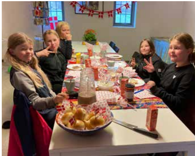
Fødselsdagshygge i caféen