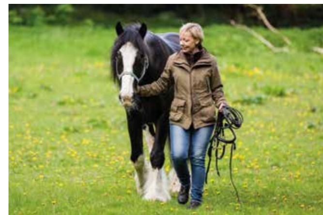
Vores placering har stor betydning

For en yngre hest, kan det at du går foran og trækker den bevirke, at den mangler de rammer den har brug for. Jeg oplever, at mange ungheste er mere trygge ved at have mennesket ved siden af dem.