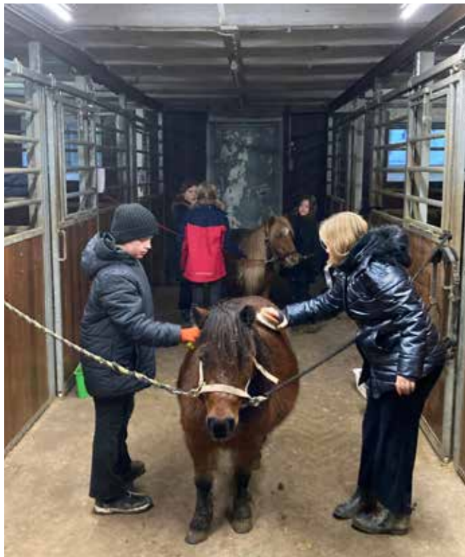
Fødselsdagshygge med ponyerne