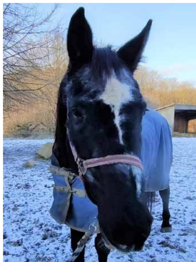
Lillebror nåede at få nogle smukke dage i sneen

Amando er en haflinger på små 20 år og Lillebror en meget stor DV blanding på 28 år. Amando var i ok stand, mens Lillebror var meget tynd og slingrede lidt på bagbenene, når han skulle vende sig. Når han gik ligeud kunne man intet se. Det viste sig desværre, da vores dyrlæge så ham efter i munden, at den var helt gal. Hans mund så virkelig slem ud. Han havde bølgebid, tandspidser og kroge, og flere af hans tænder sad så løse, at man kunne pille dem ud uden modstand. Den største udfordring i hans mund var dog, at han havde flere tværgående brækkede og flækkede tænder, der oven i det hele også havde givet ham en bihulebetændelse. De brækkede og flækkede tænder krævede en større operation at få dem trukket ud. Alle disse ting tilsammen og med hans alder taget i betragtning, var det bedste, vi kunne gøre for ham at give ham fred. Det var ikke værdigt at behandle så meget på ham. Han var så sød en hest, men vi fik ham desværre alt for sent.