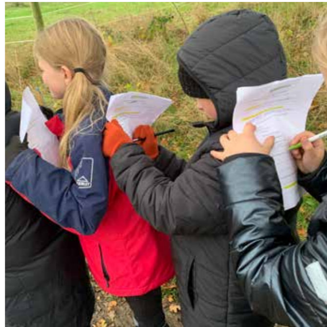
Der er sjove opgaver...