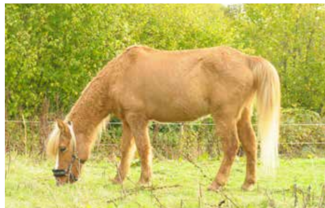
Glámur 1 måned efter ankomst

resulterede i, at de overdrog os hestene, da de ikke længere magtede at passe dyrene.