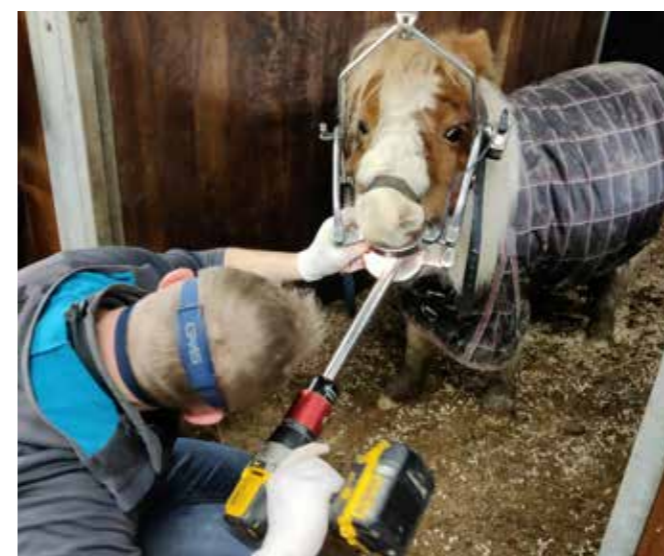
Det er vigtigt, at heste og ponyer tjekkes af fagperson med korrekt udstyr

Næsten alle de dyreværnsager, vi får ind, har hestene manglet tandbehandling. Det er dyrt at få ordnet tænder på sin hest, men det kan blive endnu dyrere i længden, hvis det er der, man gerne vil spare penge. Dårlig eller manglende tandeftersyn på heste, er oftest den største synder, når hesten ikke kan holde hulden, og hesten ellers er rask. Tænderne er lige så vigtige at holde som hestens hove, men det kan være svært at se, om der er noget galt med hestens tænder. Derfor skal der en dyrlæge eller uddannet tandspecialist til at tjekke hestens tænder med lys og spejl. Uden dette kan man ikke tjekke hestens tandsæt og tandkød.